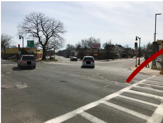
Hình ảnh giao lộ giữa Đại lộ Belmont, Đại lộ Sumner và Đường Dickinson

Ủy ban Quy hoạch Pioneer Valley Top-100 giao lộ có nhiều tai nạn nhất tại khu vực Pioneer Valley 2016